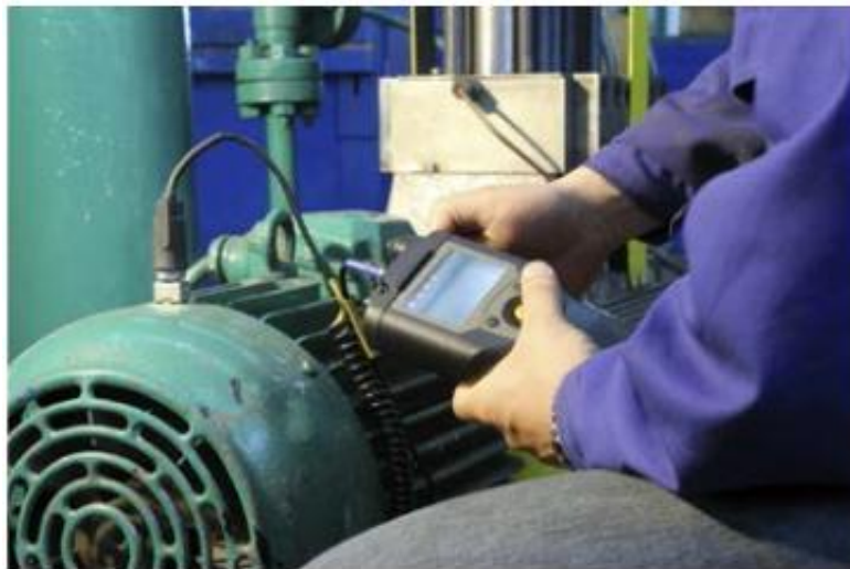
图 2. 现有的设备振动偏移监控手动探头方法缺乏可重复性和可靠性测量的频率和时间安排

现有手持式振动探头(参见图 2)在实现方法上具备一些优势，包括不需要对终端设备做任何修改，而且其集成度相对较高，尺寸较大，可提供充足的处理能力和存储空间。然而，它的一个主要局限是测量结果不可重复。探头位置或角度稍有改变，就会产生不一致的振动剖面，从而难以进行精确的时间比较。因此，维护技术人员首先需要弄清所观察到的振动偏移是由机器内部的实际变化所致，还是仅仅因为测量技术的变化所致。理想情况下，传感器应当结构紧凑并且充分集成，能够直接永久性地嵌入目标设备内部，从而消除测量位置偏移问题，并且可以完全灵活地安排测量时间。