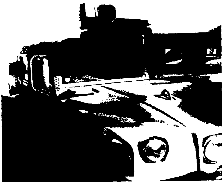
“骑马待从”车载激光系统

作为大部队的一部分,装备有“鲑鱼”系统的侦察部队执行撤退军事行动。在撤退行动中,侦察部队参与有压力撤退或无压力撤退。有压力撤退行动与掩护部队从主战场后撤相似。当侦察部队或军队没有与敌人接触时,实行无压力的撤退。当侦察部队撤出时,一个分遣队留在可对敌人进行监视的位置,该分遣队的“鲑鱼”系统以自动模式工作,随侦察部队撤退的“鲑鱼”系统,以半自动模式对敌人可能出现的其它区域进行警戒。当分遣队撤出时,侦察部队为保护其撤退提供火力掩护。