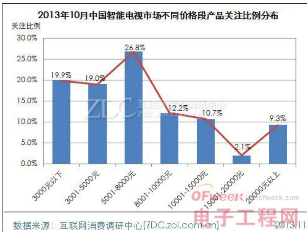
(图) 2013年10月中国智能电视市场不同价格段产品关注比例分布