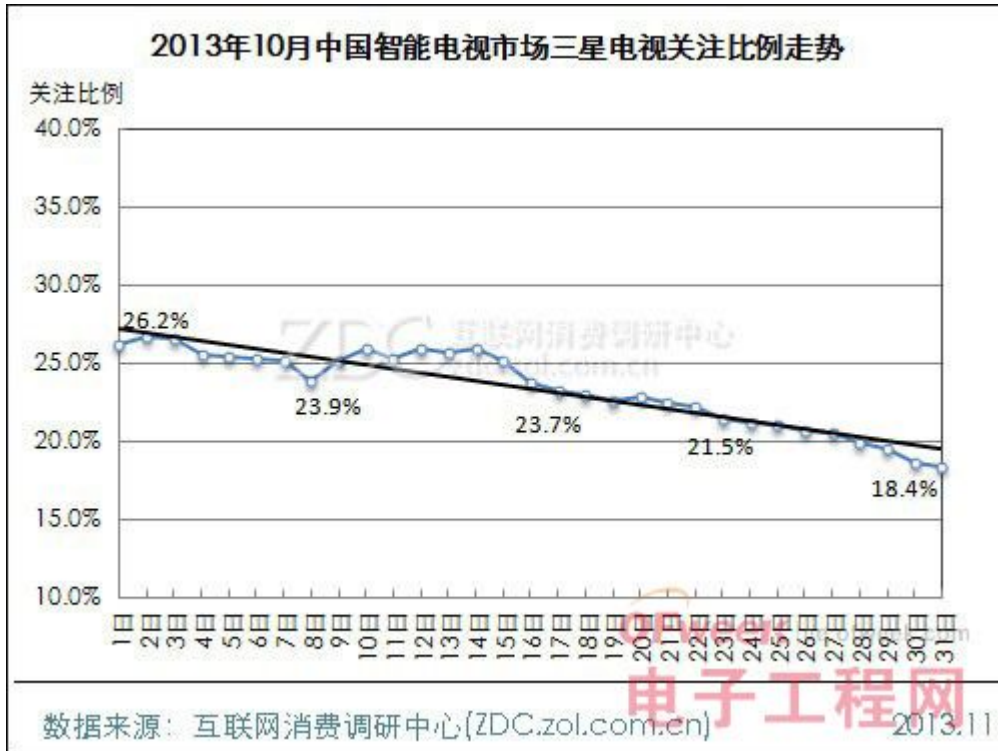
(图) 2013年10月中国智能电视市场小米电视关注比例走势