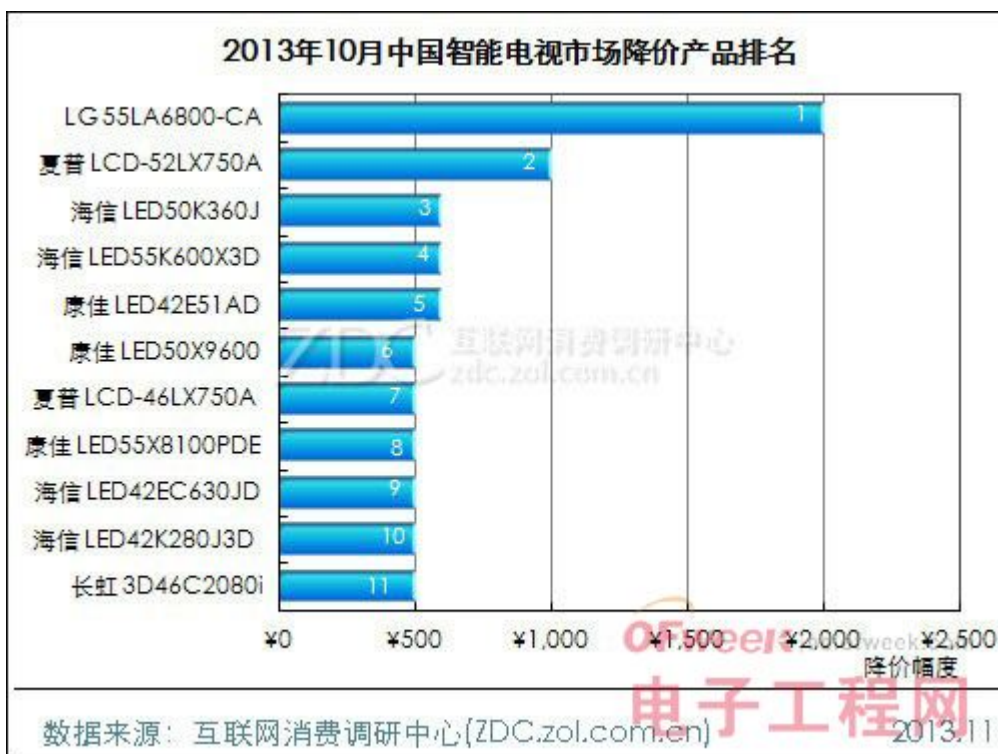
(图) 2013年10月中国智能电视市场降价产品排名