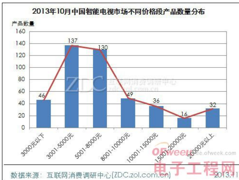
(图) 2013 年 10 月中国智能电视市场不同价格段产品数量分布

与 5001-8000 元价格段的产品数量均超百款，分别为 137 款和 130 款。其余各价格段的产品数量相对较少，均不足 50 款。