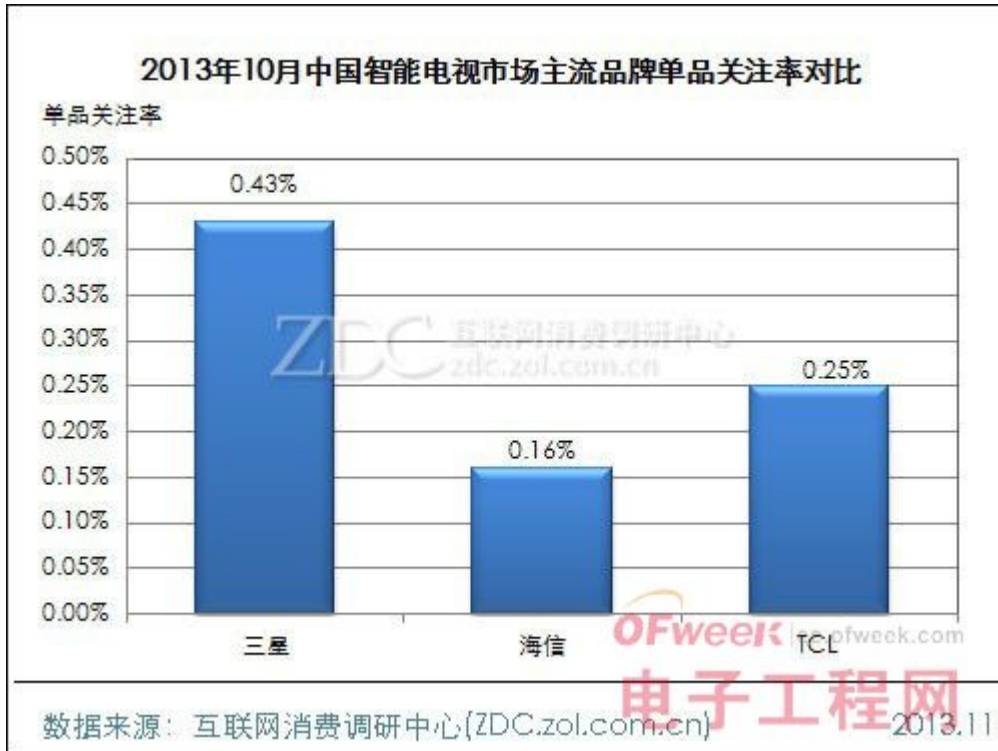
(图) 2013年10月中国智能电视市场主流品牌单品关注率对比

总结： 从品牌关注格局来看，三星一家独大的关注格局已有了明显的不同，ZDC 分析师认为原因有两个：一是以海信和 TCL 为首的传统电视厂商纷纷发力智能领域，在一定程度上打破了三星长期垄断智能领域的局面；二是小米、乐视等互联网公司也纷纷进军智能电视，并且颇受消费者的关注，抢占了一定的市场份额，从而导致三星关注度的持续下滑。