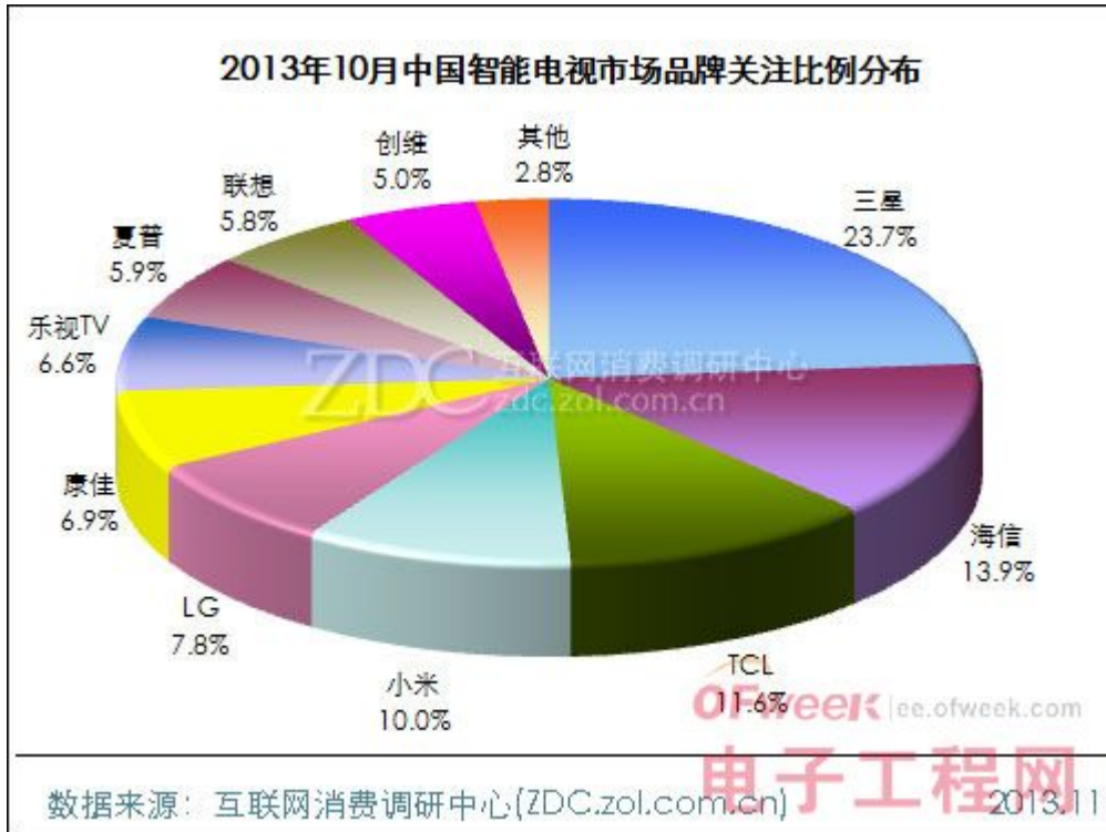
(图) 2013年10月中国智能电视市场品牌关注比例分布