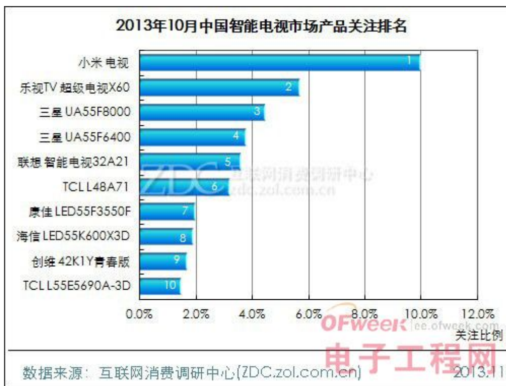
(图) 2013 年 10 月中国智能电视市场产品关注排名

可以发现，在上榜的十款产品中，报价基本在 5000 元以上，平均报价高达 6234 元。其中，三星 UA55F8000 的报价相对最高，达 13999 元；而 32 寸的联想 32A21 售价相对最低，仅为 1799 元。