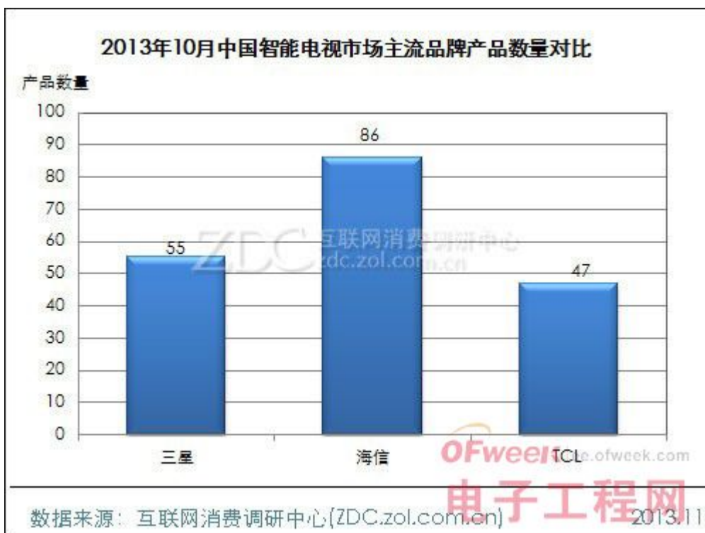
(图) 2013年10月中国智能电视市场主流品牌产品数量对比