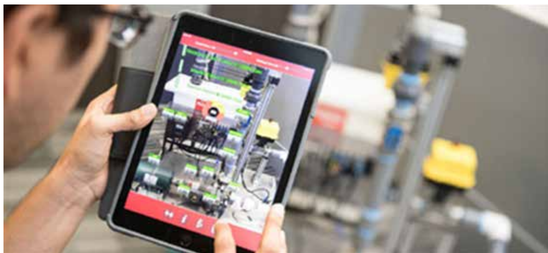
图 3.AR 和互联设备，成为智能工厂的组成部分

越来越多的商业设备正在互联，为工业物联网 (IIoT) 提供动力。在未来的智能工厂里，每一台机器将通过网络连接在一起，相互通信，并与和它们交互的人类操作员通信。人类可以使用与 AR 配对的工业物联网数据来实时查看作业状态和机器运行状况，并在出现问题时提供故障解决建议。未来的智能工厂并不会将人类从工艺流程中撤出，而是人类在 5G 技术的辅助下，与机器进行无缝协作。