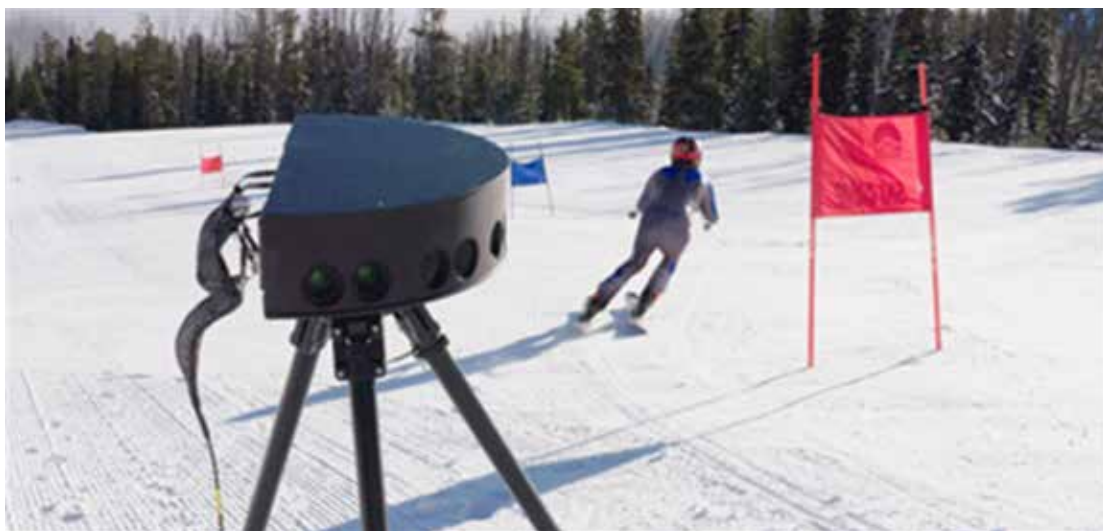
图 2.英特尔的真实虚拟现实设备应用于 2018 年冬季奥运会